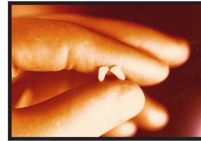
Ongebore baba se voet by 10 weke

Volgens die Bybel is GOD DIE OORSPRONG VAN ALLE LEWE.